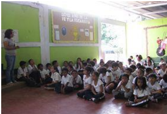
Prämierungen der besten Schüler im Schulhof