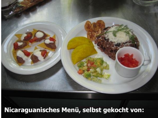
Nicaraguanisches Menü, selbst gekocht von:

Benefizanlass 15. Juni im Alleehaus, 8008 Zürich