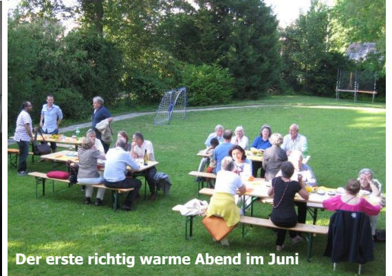
Der erste richtig warme Abend im Juni

Marktstände Zollikerberg, 8. September und Wädenswil, 24. November, Infoveranstaltung Windisch, 31. Oktober