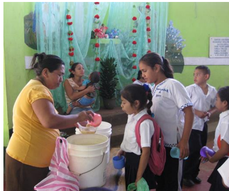
Essensausgabe am Mittag