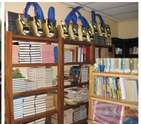
Bibliothek mit den Büchern aus Gran Canaria