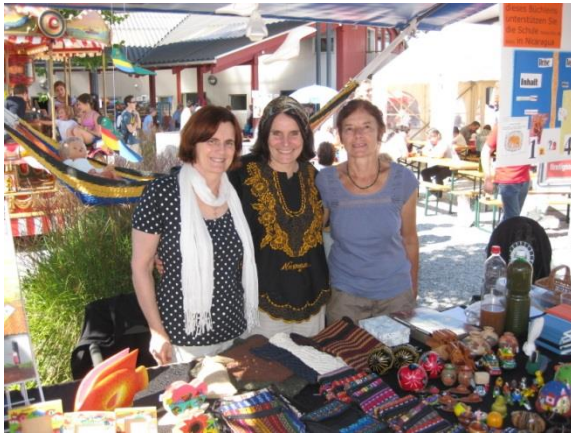
Vorstandsmitglieder Maya, Margarita, Mathilde, im Zollikerberg

Marktstände Zollikerberg, 8. September und Wädenswil, 24. November, Infoveranstaltung Windisch, 31. Oktober